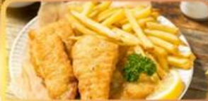
Fish and Chips