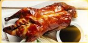
เปิด Four Season