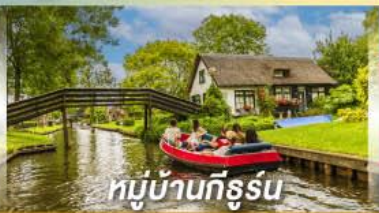
หมู่บ้านทีรูร์น