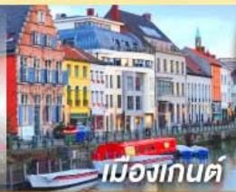
เมืองกันต์